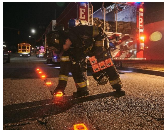
Schnelle und unkomplizierte Verlegung durch eine Person